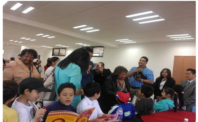
Foto: Visita del CONTUA (Confederación de los trabajadores y trabajadoras de las Universidades de las Américas) en CEPPSTUNAM