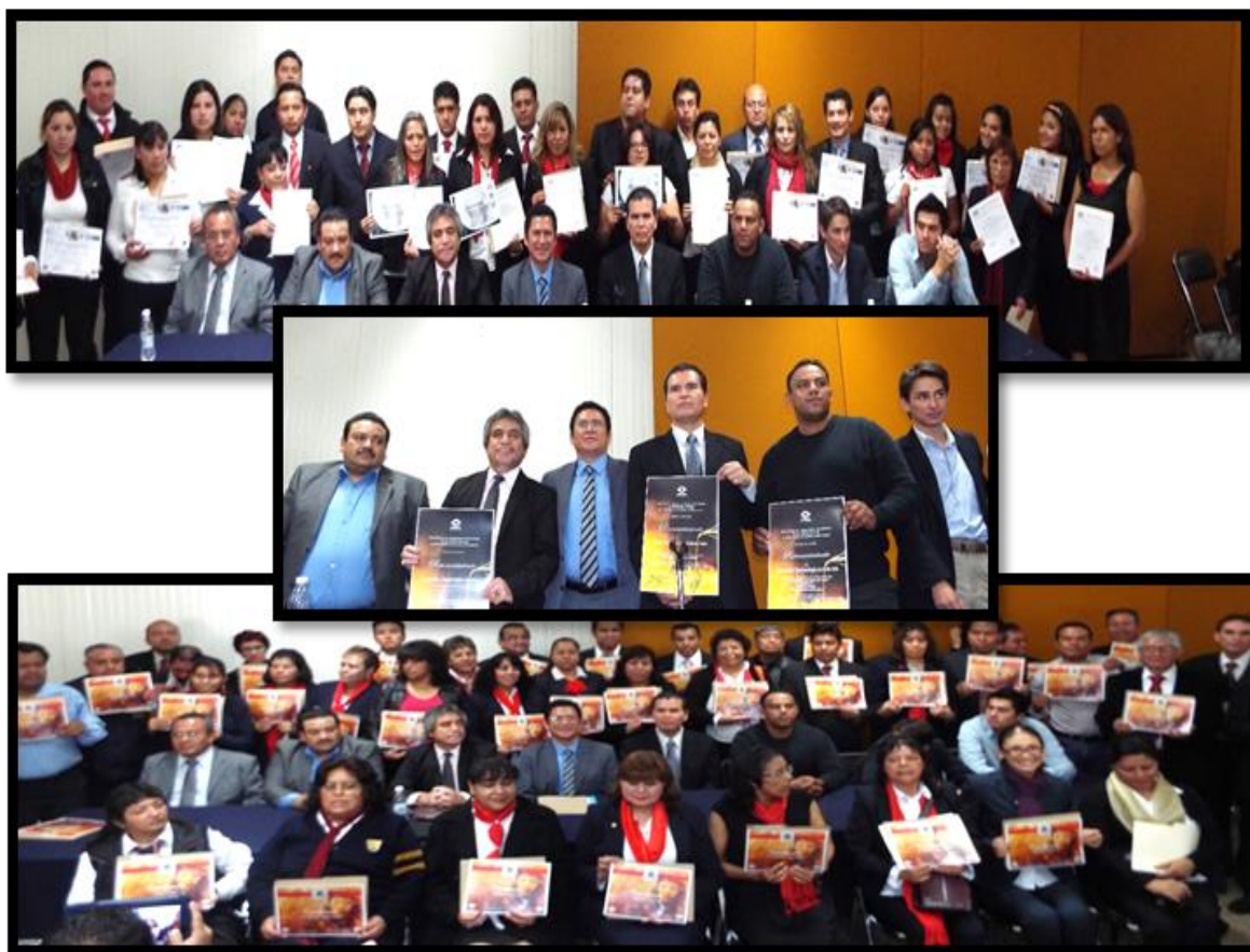
Foto: Ceremonia de entrega de Constancias de “Liderazgo y Dirigencia Sindical”, “Mantenimiento de Pc y Laptops”, “Contabilidad y Power Point” y “Computación”.