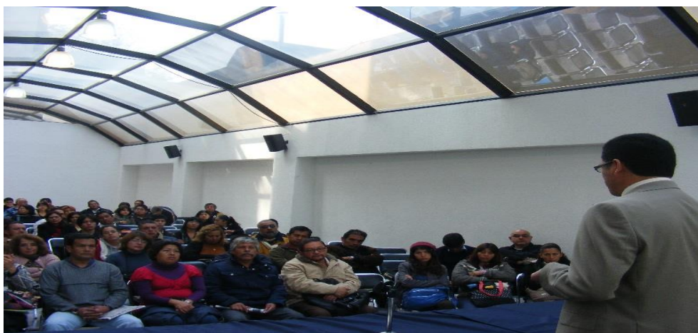
Foto: Platica Informativa en la Casa Cultural STUNAM "Emiliano Zapata"

En consideración al segundo párrafo de la Cláusula No. 90 del Contrato Colectivo de Trabajo Vigente, se publicó en septiembre de 2013 la Convocatoria para obtener la Beca Económica para el ciclo escolar 2013-2014, como resultado se otorgaron 300 becas para trabajadores e hijos, en su calidad de estudiantes de los niveles Iniciación Universitaria, Bachillerato y Licenciatura de la UNAM, en apego al convenio suscrito entre la UNAM y el STUNAM el pasado 31 marzo de 2000.