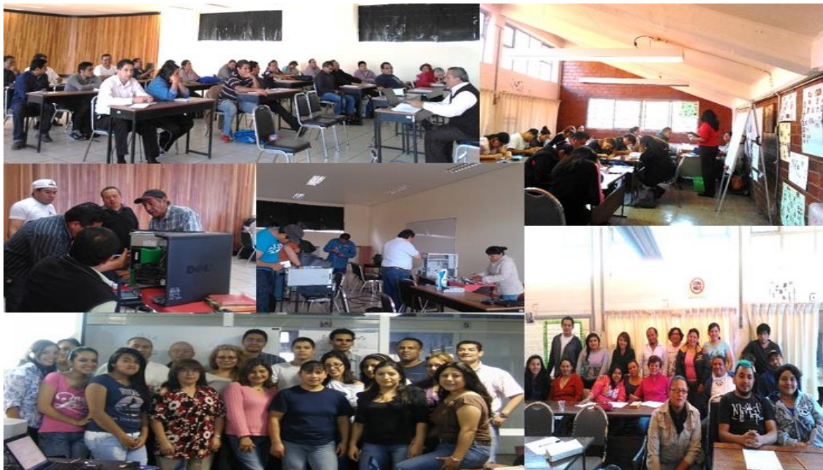
Foto: Cursos en las Dependencias