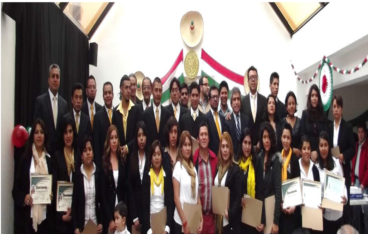
Foto "Acreditados Nivel Bachillerato" en la Casa Cultural STUNAM "Emiliano Zapata".

Por lo que refiere, a la Preparatoria Abierta de la SEP se encuentra actualmente en Línea, y está integra 25 Módulos, cada uno ofrece contenidos curriculares y materiales didácticos, esquemas de apoyo académico y una plataforma educativa virtual.