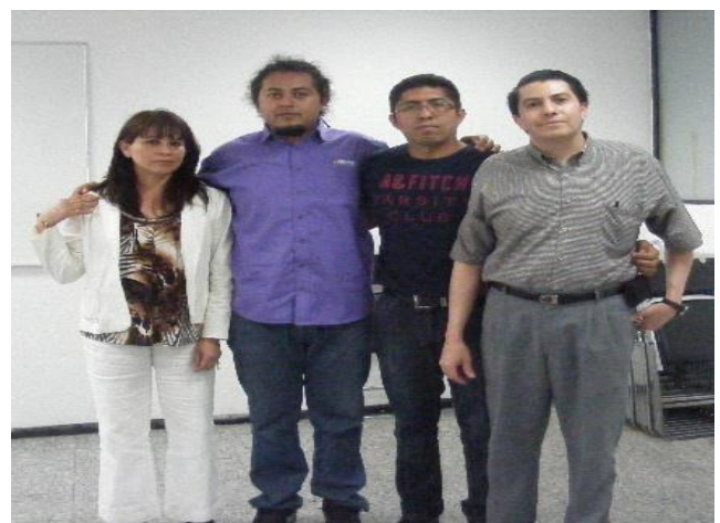
Foto: Alumnos del Curso de Oratoria y Locución en la Casa Cultural STUNAM “Emiliano Zapata”.