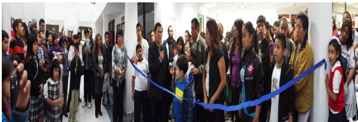
Foto: Inauguración de la Exposición "Lucha Libre" en las instalaciones de Centeno 145