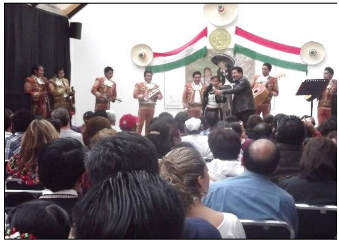
Foto: Noche Mexicana STUNAM 2013, en la Casa Cultural