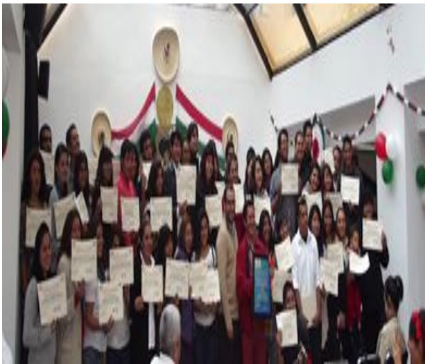
Foto: Entrega de Reconocimiento "Curso de Verano 2013" en la Casa Cultural