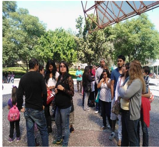
Foto: Niños y padres de familia fuera de UNIVERSUM