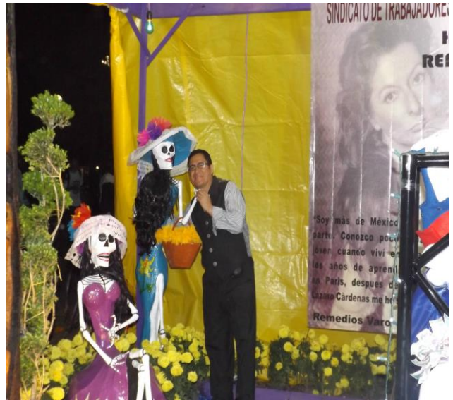
Foto: Mega Ofrenda STUNAM 2013 en las Islas.