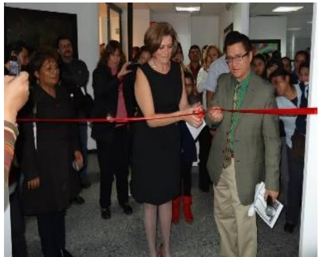
Foto: Inauguración de la Exposición "Pausa" en la galería de la Casa Cultural STUNAM "Emiliano Zapata"