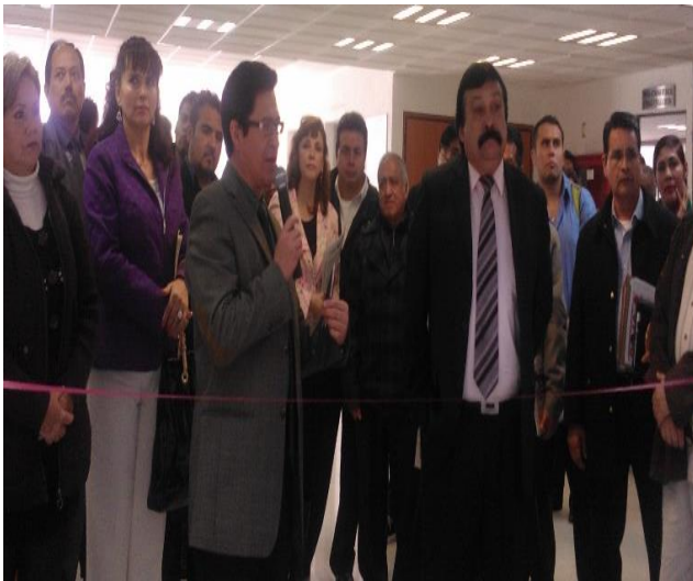
Foto: Inauguración de la Exposición "Corazón VS Maquillaje" en la galería de Centeno