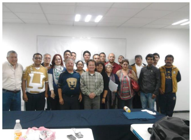
Foto: Seminario “ABC del Delegado Sindical” en la Casa Cultural STUNAM “Emiliano Zapata”.