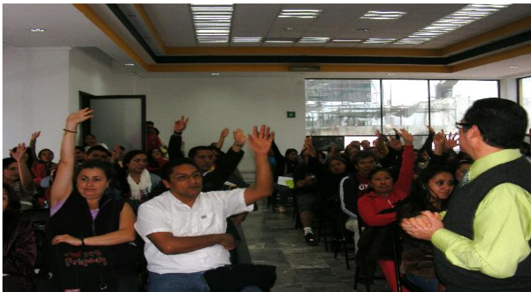
Foto: Platica Informativa CEPPSTUNAM en la Casa Cultural STUNAM "Emiliano Zapata".