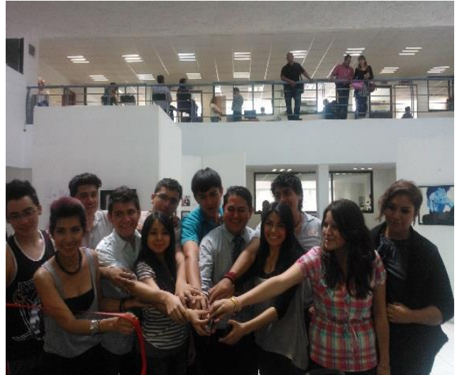
Foto: Inauguración de la Exposición "Maleducados" en la galería de Centeno