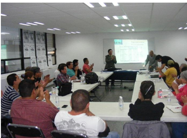
Foto: Seminario “ABC del Delegado Sindical” en la Casa Cultural STUNAM “Emiliano Zapata”.