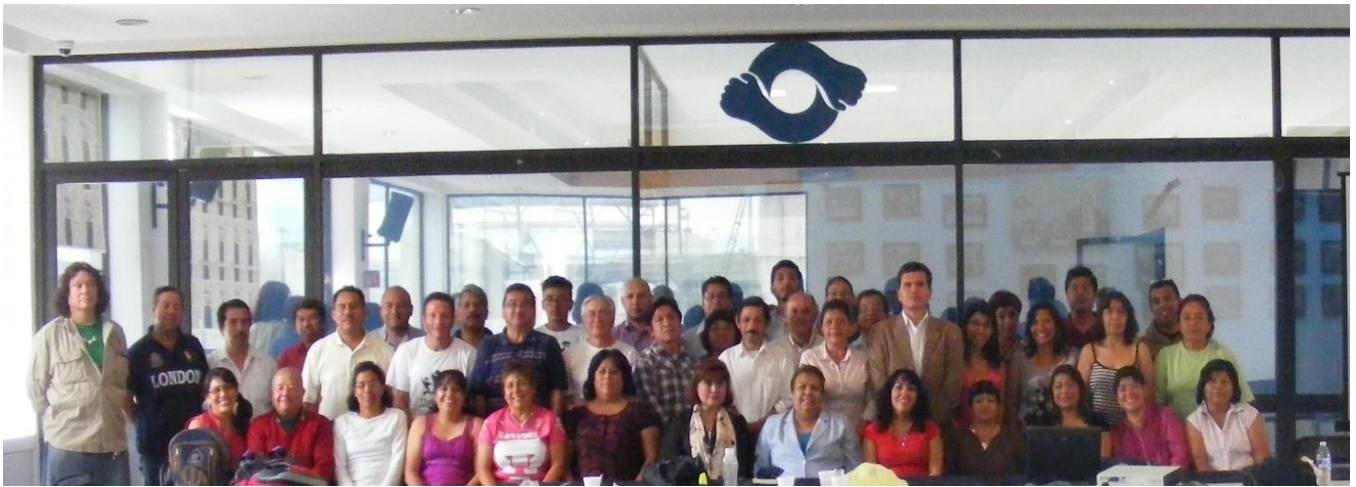
Foto: Seminario “Liderazgo y Dirigencia Sindical” en la Casa Cultural STUNAM “Emiliano Zapata”.