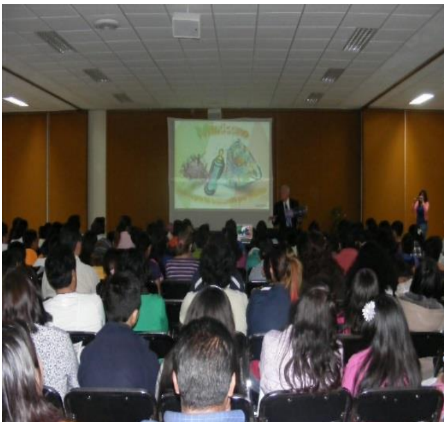
Foto: Plática a los padres e hijos de Iniciación Universitaria, en el auditorio principal de Comisiones Mixtas.