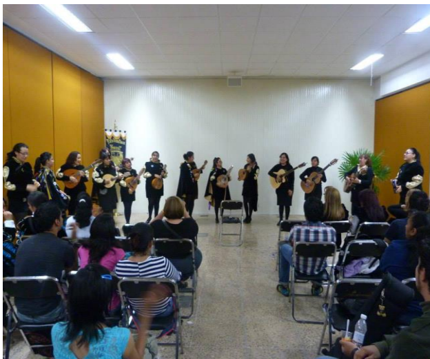
Foto: Estudiantina una canción UNAMigo, en Comisiones Mixtas