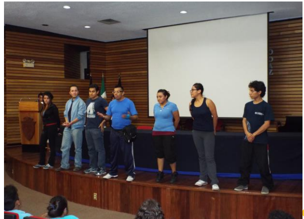
Foto: Capacitación Monitores en la Facultad de Derecho, auditorio "Dr. Eduardo García Máñez"