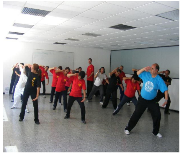
Foto: Seminario Internacional de Taijiquan, en la Casa Cultural