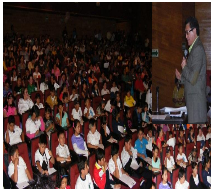
Foto: Plática a los padres e hijos de Iniciación Universitaria, en el auditorio "Ricardo Flores Magón" de la Fac. de Ciencias Políticas.