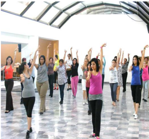
Foto: Clases de Salsa en la Casa Cultural STUNAM “Emiliano Zapata”

La promoción, realización y producción Cultural del STUNAM, desde la perspectiva sindical es sin duda alguna una experiencia de las más importantes, por su visión integral, así como su misión sociocultural, que incorpora valores, principios y creencias que fortalezcan el desarrollo humano y la superación colectiva de los trabajadores y sus familias desde una perspectiva participativa e incluyente, a fin de retomar las raíces histórico-sociales México.