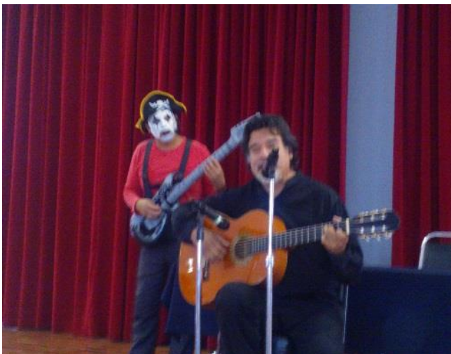
Foto: Obra de Teatro "Invisible" para los padres e hijos de Iniciación Universitaria, en el auditorio principal de Centeno 145.