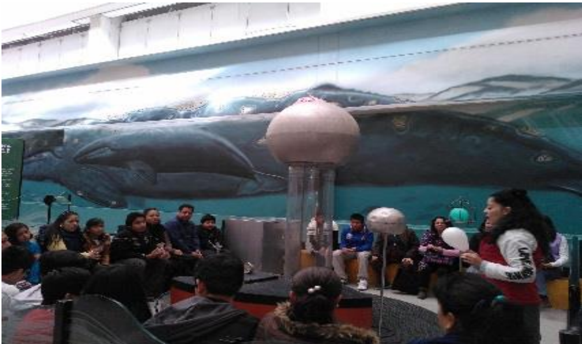
Foto: Niños y padres de familia fuera de UNIVERSUM