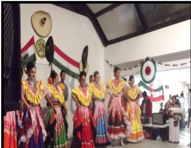
Foto: Noche Mexicana STUNAM 2013, en la Casa Cultural