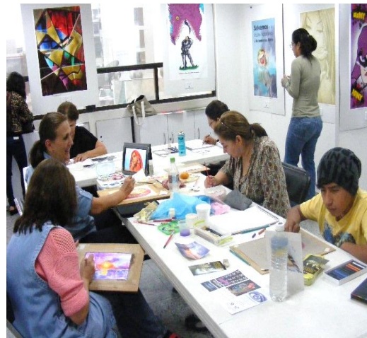
Foto: Clases de Dibujo al Pastel en la Casa Cultural STUNAM “Emiliano Zapata”