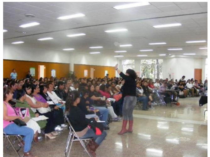
Foto: Plática a los padres e hijos de Iniciación Universitaria, en el auditorio principal de Comisiones Mixtas.