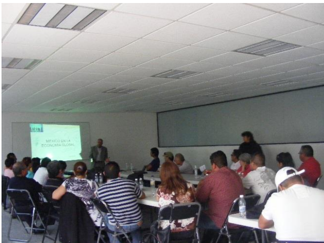
Foto: Clase del Seminario “ABC del Delegado Sindical” en la Casa Cultural STUNAM “Emiliano Zapata”.