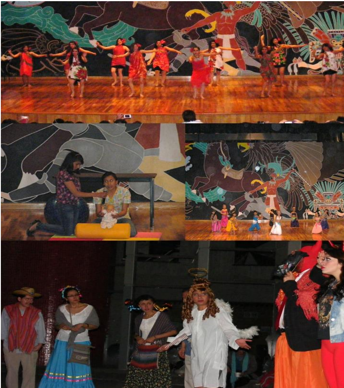
CLAUSURA CURSOS Y TALLERES 2013-2 10 DE DICIEMBRE DE 2013 EN FACULTAD DE CIENCIAS POLÍTICAS AUDITORIO "RICARDO FLORES MAGÓN"