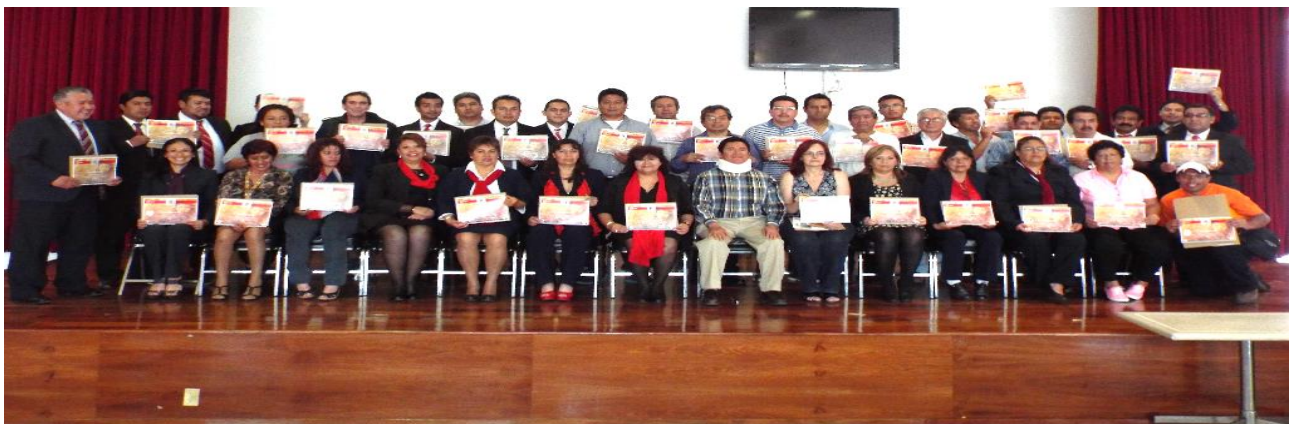
Foto: Entrega de constancias Seminario "ABC del Delegado Sindical y Liderazgo", en las instalaciones de Centeno 145