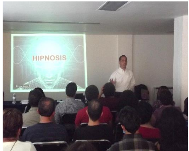
Foto: Conferencia Hipnosis en la Casa Cultural