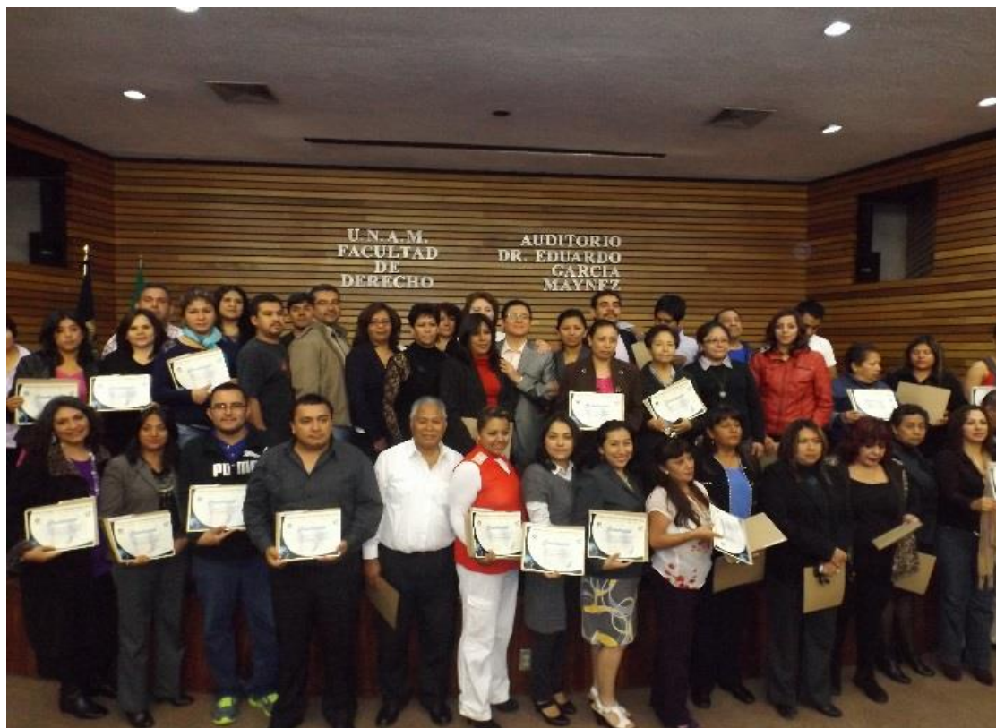
Foto: Entrega de constancias del curso de Programación Neurolingüística en la Facultad de Derecho, auditorio "Dr. Eduardo García Máñez