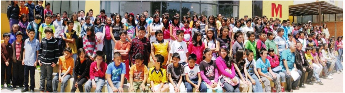
Foto: Plática y presentación del modelo educativo de Iniciación Universitaria en Centeno 145