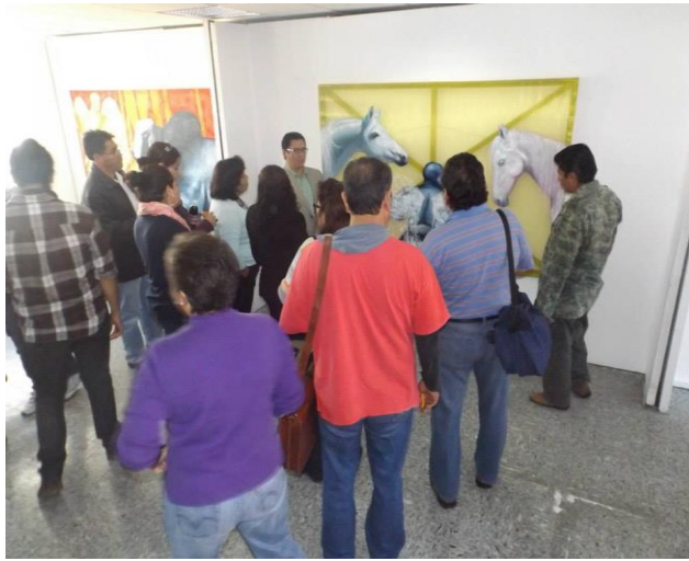
Foto: Inauguración de la Exposición "Nina Koba" en la galería de la Casa Cultural STUNAM "Emiliano Zapata"