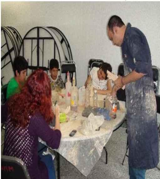
Foto: Clases de Escultura en Arcilla en la Casa Cultural STUNAM “Emiliano Zapata”