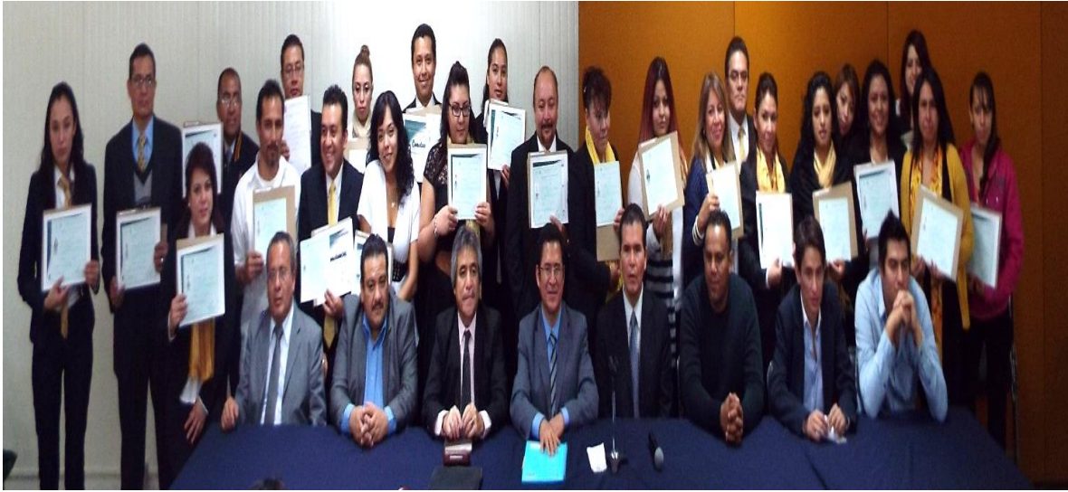
Foto: "Acreditados Nivel Bachillerato" en las instalaciones de Comisiones Mixtas.