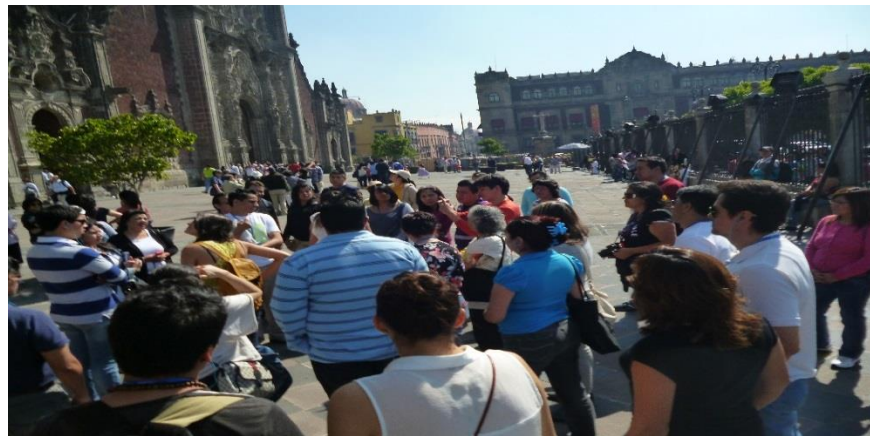
Foto: Alumnos de Preparatoria Abierta, a un costado de la Catedral Metropolitana

Como parte complementaria a la materia de Transformaciones en el mundo contemporáneo, se llevaron a cabo visitas guiadas, el pasado 2 de marzo de 2014, entre la Catedral Metropolitana, edificios históricos y la Calle Madero.