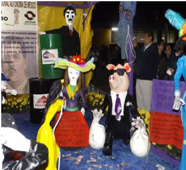
Foto: Mega Ofrenda STUNAM 2013 en las Islas.