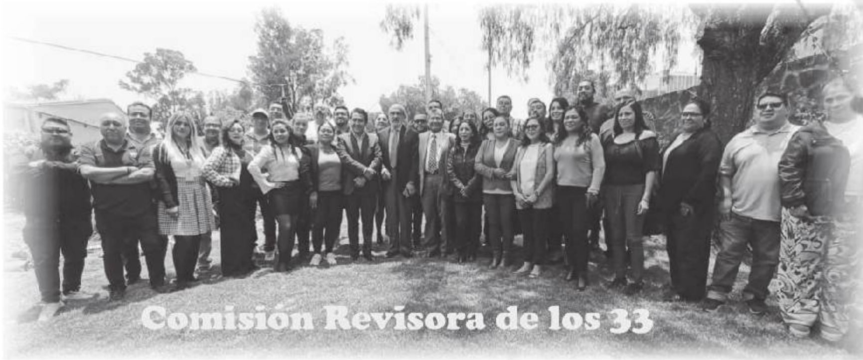
Comisión Revisora de los 33