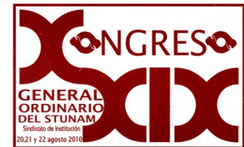
LOGOTIPO DEL XXIX CONGRESO GENERAL ORDINARIO

Ya son 30 congresos los realizados, los que sin duda han dejado huellas en el ambiente político del país y de la UNAM, ya que por ejemplo desde estos han salido propuestas democráticas de cambio de rumbo económico para nuestro país que se han contrapropuesto a los designios neolibe-