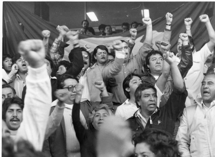
LOS TRABAJADORES CELEBRAN LA CONFORMACIÓN DEL STUNAM