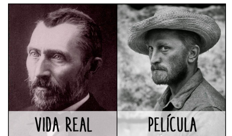
Vincent van Gogh / Kirk Douglas