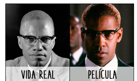
Malcolm X / Denzel Washington