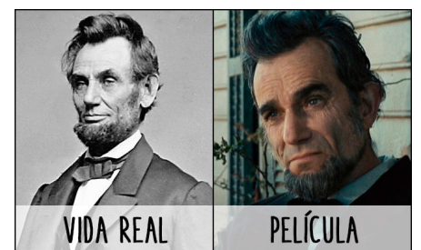
Lincoln / Daniel Day-Lewis