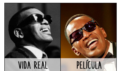
Ray Charles / Jamie Foxx