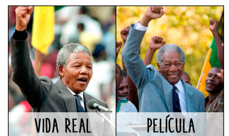
Nelson Mandela / Morgan Freeman