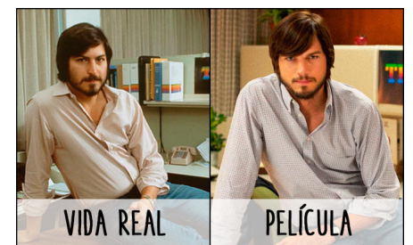
Steven Jobs / Ashton Kutcher