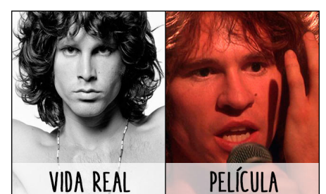
Jim Morrison / Val Kilmer