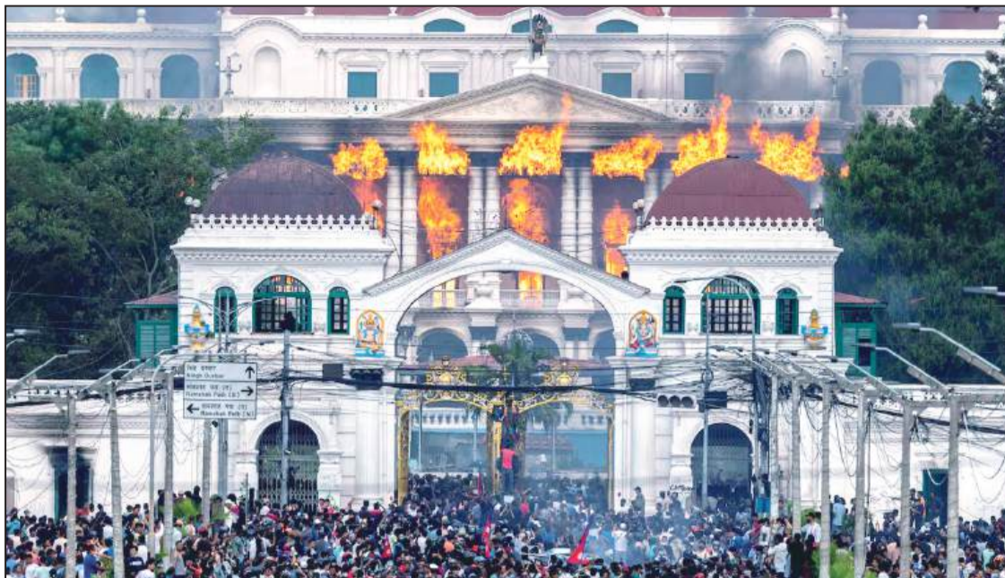
Protestas incendiarias en Nepal.