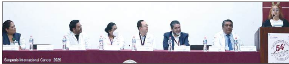
Simpósio Internacional Cáncer 2025