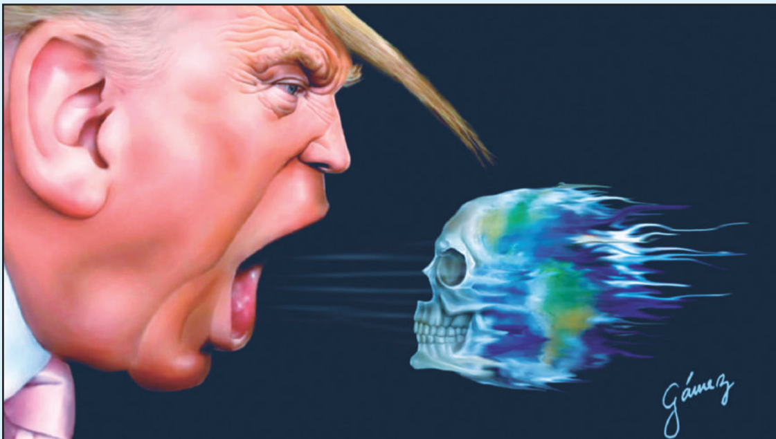
Imagen: Armando Gómez