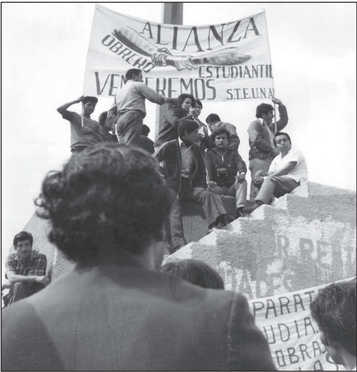
Mitín en Rectoría para estallar la huelga, 1972.