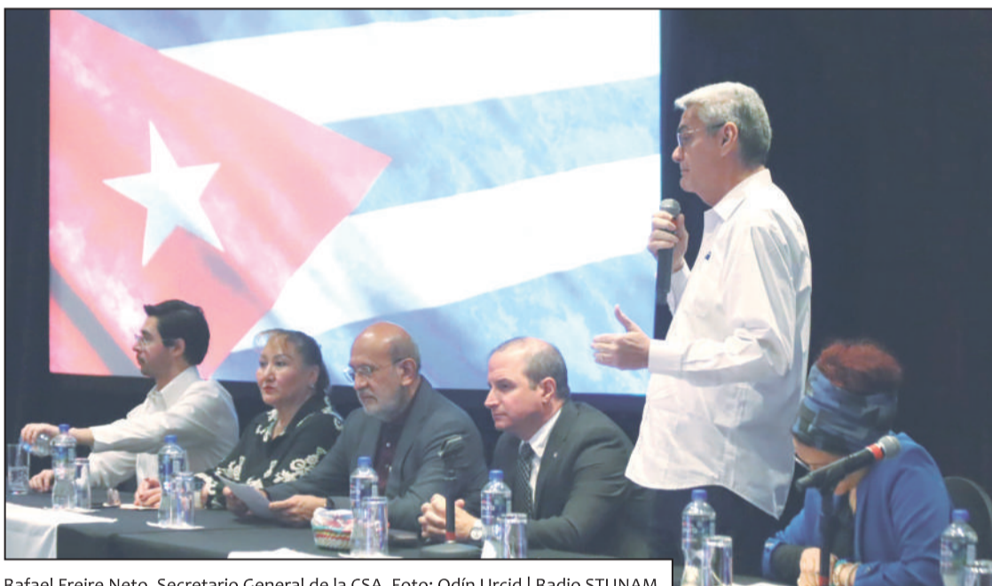
Rafael Freire Neto, Secretario General de la CSA.

Como resultado del encuentro se aprobó por los participantes una Moción de Solidaridad con Cuba donde se reconoce la capacidad de resistencia de los trabajadores y pueblo cubanos, y se realizó un llamado para implementar acciones que fortalezcan el respaldo y la solidaridad con Cuba desde el movimiento sindical regional e internacional. 🗳️