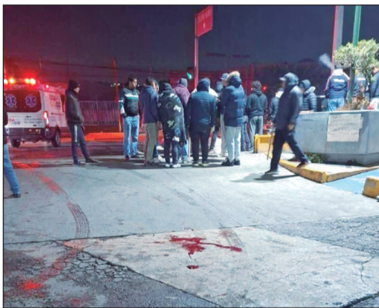
Indicios de sangre tras el ataque a trabajadores de Tornel.

Este conflicto estalló después de meses de inconformidad por violaciones laborales que, reiteradamente han sido denunciadas por los trabajadores, agremiados en el Sindicato Nacional de Trabajadores de la Compañía Hulera Tornel (SINTCHT), las cuales no fueron resueltas ni siquiera mediante procesos de conciliación vinculados al T-MEC, como el Mecanismo de Respuesta Rápida. Desde entonces, más de mil trabajadores han sostenido el paro, instalando campamentos en los accesos a las instalaciones y deteniendo una producción clave para la industria llantera en el país.