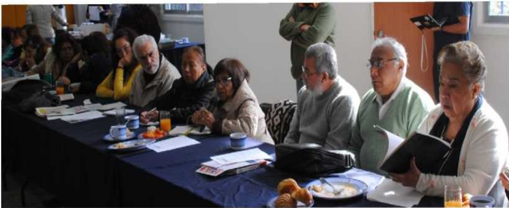
Reunión académica 2016

Entrevista realizada por: Gabriela Silva Morales