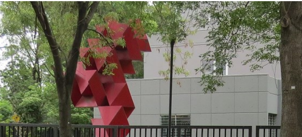
FES IZTACALA UNAM 2024