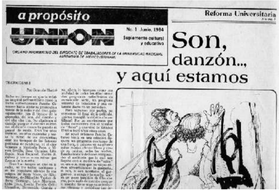
Leticia Ocharán (†1997), imagen A propósito N° 1