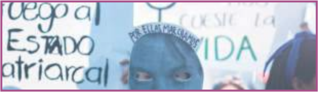
Marcha 8 de marzo de 2019.

El martes 9 de abril se convocó en el Centro Cultural Universitario a colectivos feministas, organizaciones políticas, sindicales y populares a un espacio de diálogo para tener una primera reflexión sobre el cuestionamiento público al #MeToo mexicano a partir del suicidio de Armando Vega Gil, integrante de Botellita de Jerez.