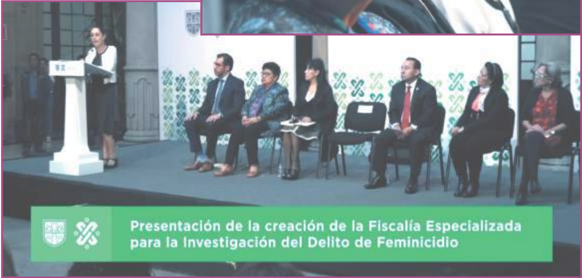
Anuncio sobre creación de Fiscalía Especializada en Feminicidios. Video disponible en: https://www.youtube.com/watch?v=qGuXb5CLu4