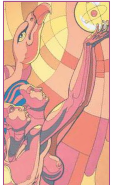
Mural “Por mi raza hablará el espíritu” (fragmento), ubicado en Centeno 145.

La reforma constitucional de paridad de género, al 4 de junio,