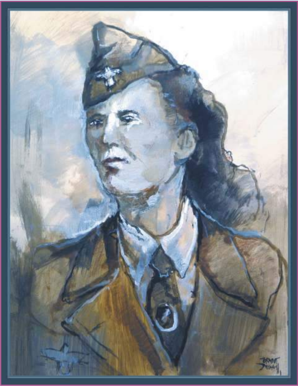
“Helferin Lutwaffe”, arte militar. Autor: Ernest Descals.