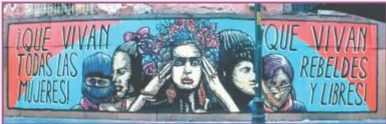
¡Que vivan todas las mujeres! ¡Que vivan rebeldes y libres!. Mural y fotografía: Facebook Gran Om

“Las mujeres sostienen la mitad del cielo, porque con la otra mano sostienen la mitad del mundo” - Mao Tze Tung