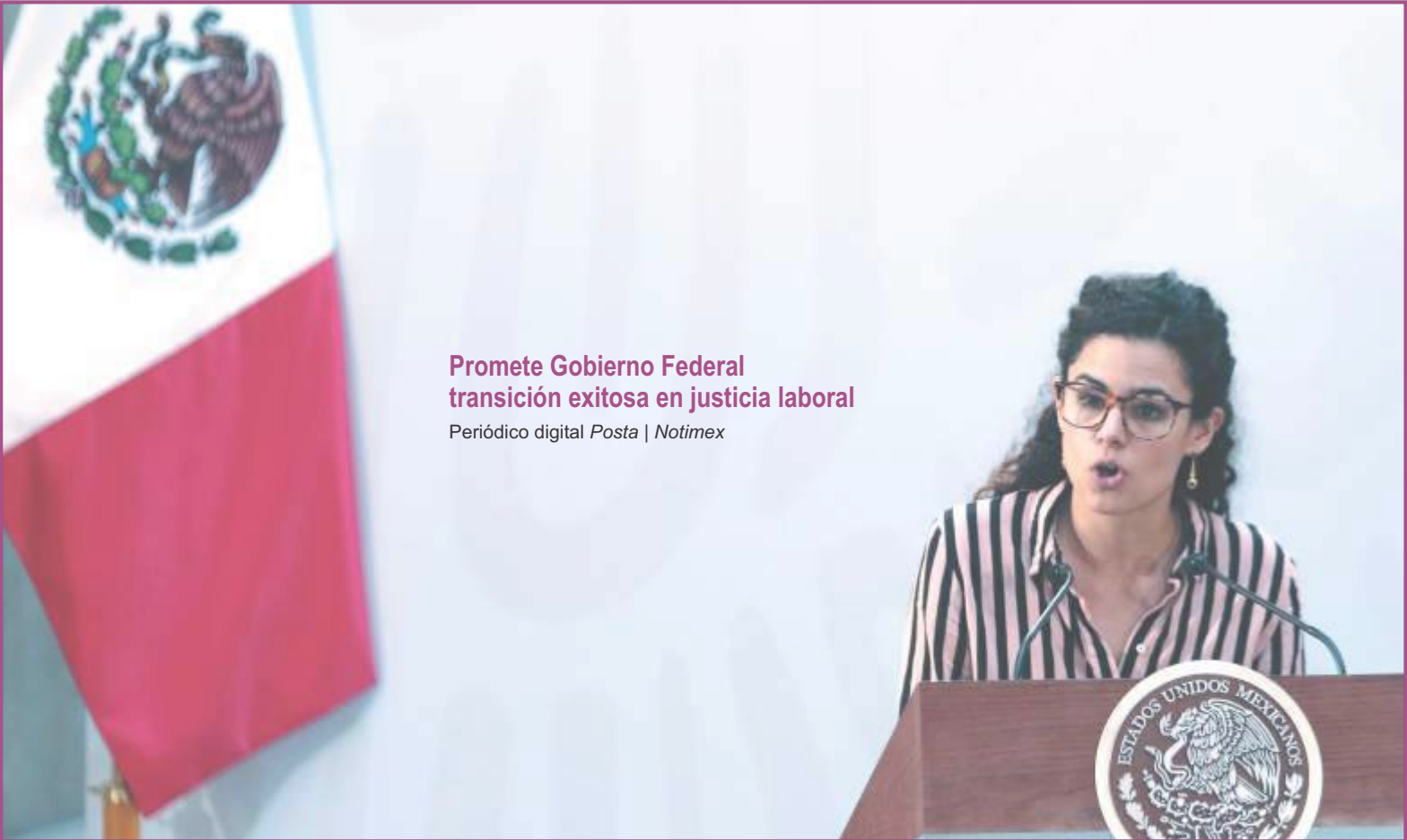
Promete Gobierno Federal transición exitosa en justicia laboral Periódico digital Posta | Notimex

La reciente reforma no es suficiente, se debe seguir impulsando los cambios hasta alcanzar un empleo digno para las trabajadoras que contemple: salarios dignos, justicia laboral; eliminación del outsourcing y de la brecha salarial; cero discriminaciones y otras desigualdades que han empobrecido a las Mujeres Trabajadoras y les han restado calidad de vida y capilaridad social. ●