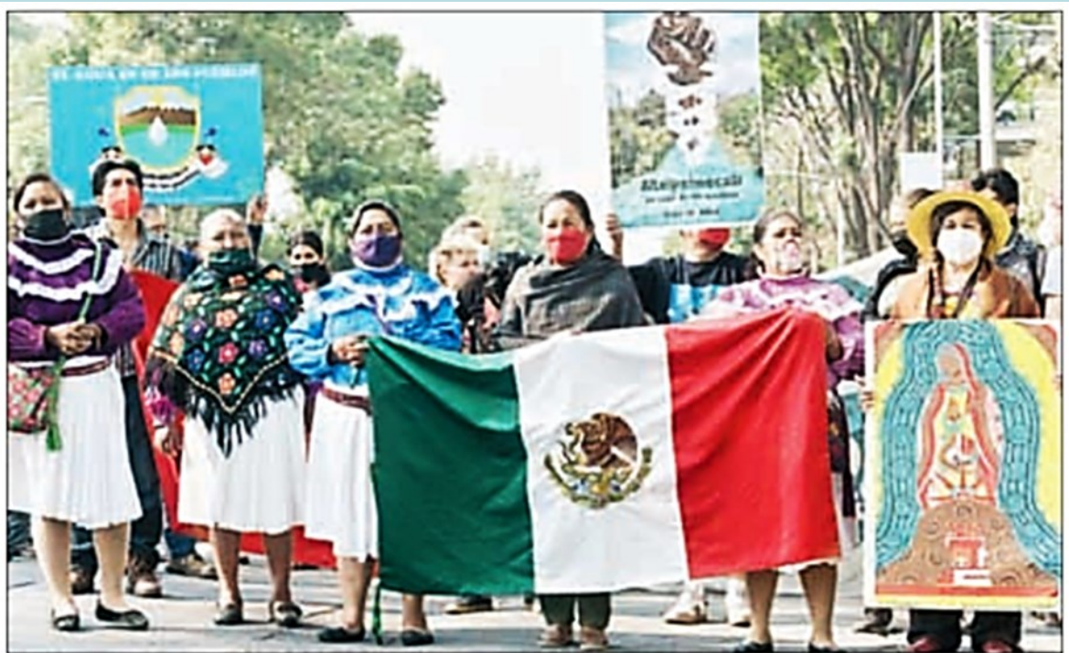
"Megaproyectos prueban que sigue el despojo capitalista" periódico "La Jornada" 9 de abril de 2022 página 8