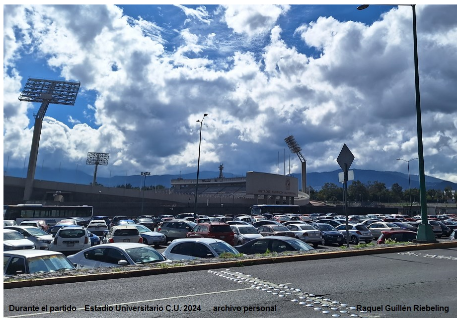
Durante el partido – Estadio Universitario C.U. 2024

Raquel del Socorro Guillén Riebeling Abril de 2024