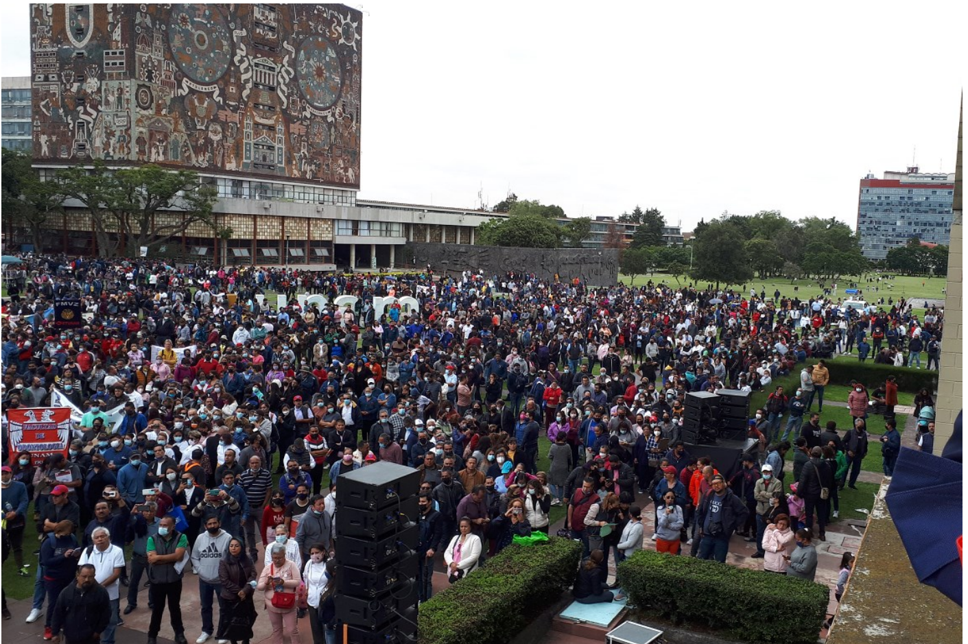
Lucha Sindical Rectoría 2022

Stiglitz, J. (2002) El malestar en la globalización. Taurus. Serie Pensamiento (Quinta Edición), Madrid, España.